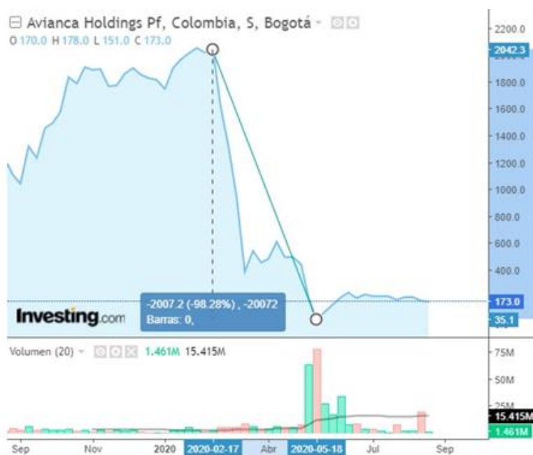
Figura 2 Análisis de tendencias en acciones Avianca Holdings. 2020-05-17

El análisis técnico de Avianca Holdings S.A. se centra en el estudio de los movimientos de precios y el volumen de negociación de las acciones de la empresa en el mercado bursátil. Este enfoque se basa en la premisa de que la acción del precio refleja todas las variables relevantes, incluyendo noticias, fundamentos de la empresa y expectativas del mercado.