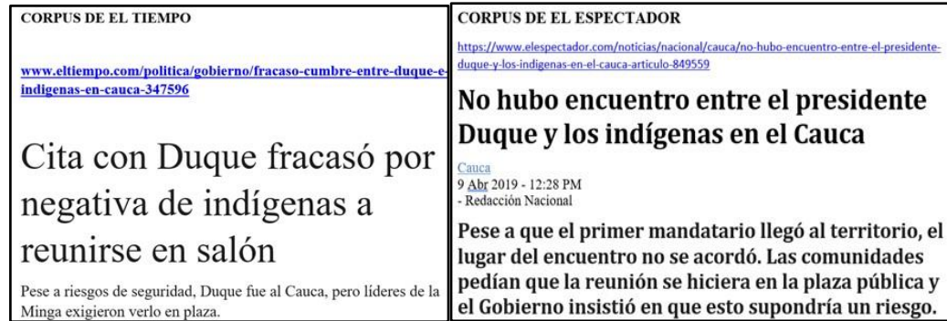
Figura 2. Corpus seleccionados extraídos originalmente de las páginas de internet de los periódicos El Tiempo y El Espectador (ver Apéndice B).

nacional, espacios de construcción de la agenda y del debate político en el país, y principales referentes informativos de la opinión pública (Rueda, 2011).