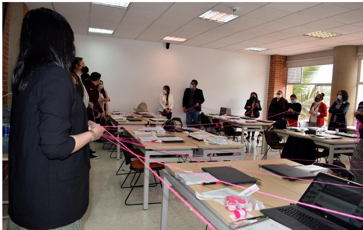
Fotografía #6 Presentación Proyectos Escolares.