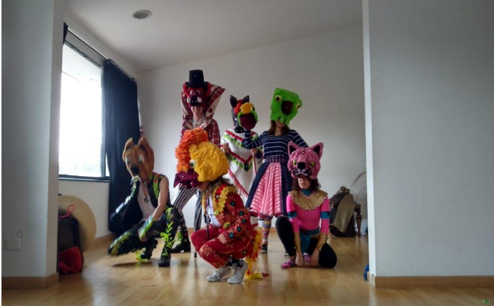
Figura 5. Ensayo músicos de Bremen.