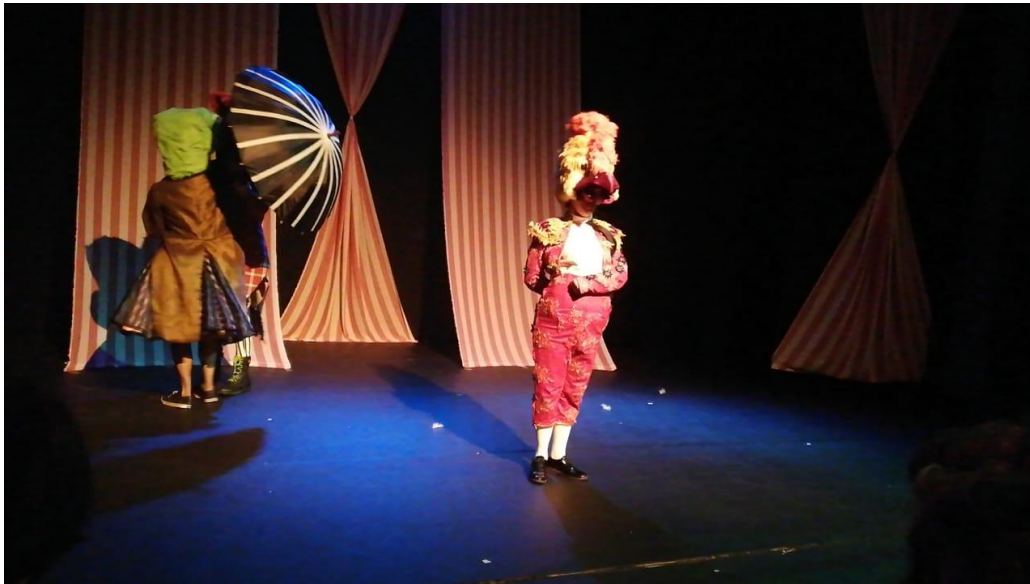
Figura 6. Estreno Los músicos de Bremen (12 diciembre 2018), teatro La libélula Dorada (Bogotá D.C).

En el segundo caso veremos como el animal me ayudó a crear ciertas peculiaridades del personaje de Alba del cuadro «Oferta especial» en la obra Sketches de revista del dramaturgo y director inglés Harold Pinter, esta obra se escribió en 1959 y es una recopilación de diferentes situaciones que suceden en una ciudad (en este caso se