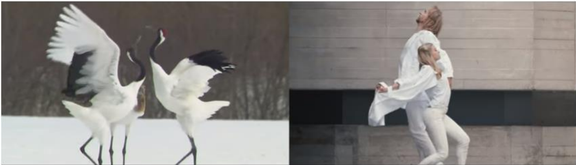
Figura2. Act of love.