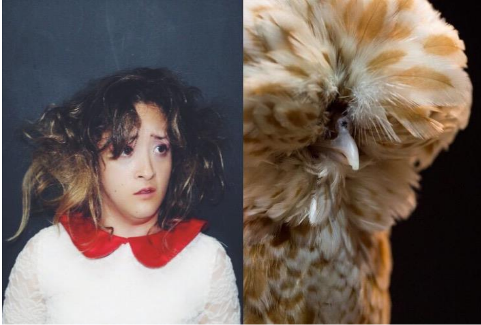
Figura 7. Referente Gallina Padovana.

decir que no sería tan fuerte si me basara solo en un animal dado a la infinidad de propuestas que puedo obtener de la hibridación de más animales.