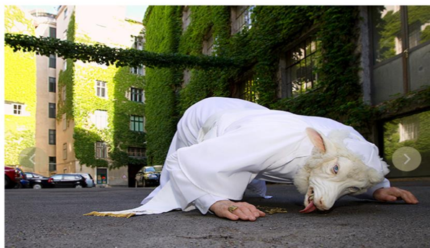
Selig sind die Unwissenden, 2011 Preparación taxidérmica, cera, Serie: Selig sind die Unwissenden tamaño real.