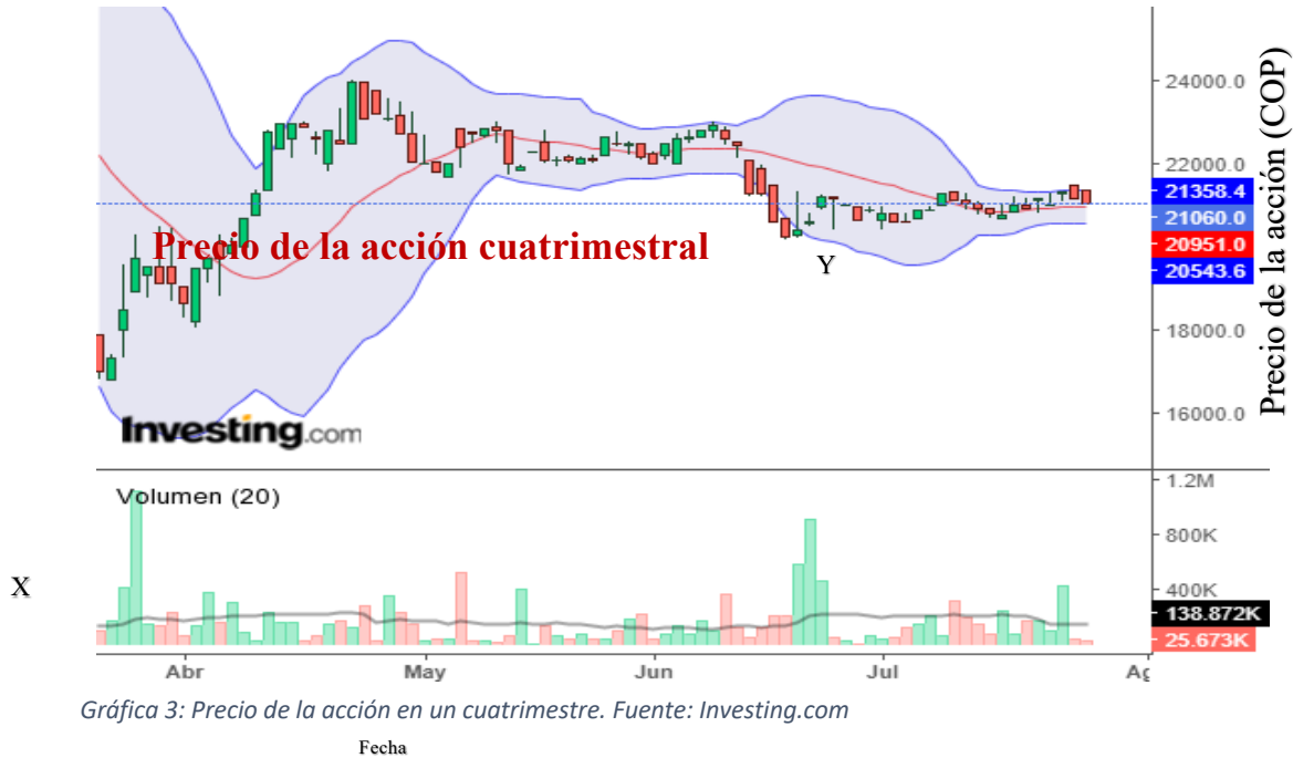
Gráfica 3: Precio de la acción en un cuatrimestre.

En esta última gráfica que se expone, por un lado, se observan las “bandas de Bollinger” y generalmente si la acción llega a los límites superiores de éstas la acción baja como en el caso entre abril y mayo que se encontró alrededor de los 23.500COP y por el contrario si llega a los límites inferiores, la acción sube como entre junio y julio donde incluso estuvo un poco debajo y llegó a los 20.951COP; también podemos ver cómo tras el pánico en el mercado por la contingencia la acción subió constantemente por varios días seguidos desde 18.000COP aproximadamente hasta los 23.000COP y a partir de esa fecha no ha tenido caídas tan “graves” como las anteriores y se ha mantenido de alguna forma, “estable” entre más pasa el tiempo, se podría decir incluso que si se trazase una línea de tendencia durante el periodo, ésta sería ascendente y se trazaría como soporte, es decir que los compradores se han incrementado, valorizando la acción de 17.000COP aprox. en abril hasta alrededor de 22.000COP.