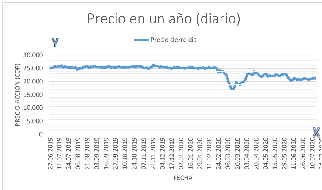
Gráfica 1: Precios de la acción en un año.

crisis por el coronavirus. A continuación, se verán un poco más a fondo algunas gráficas que permiten comprender mejor los movimientos del precio de la acción en el mercado.