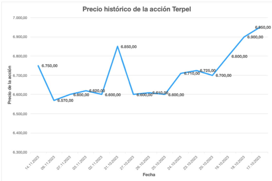
Figura 1. Precio histórico de la acción Terpel.