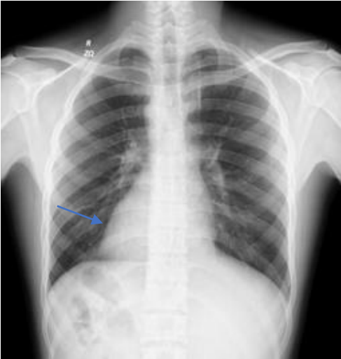
Figura 2. Radiografía de tórax: (flecha azul ) corazón en hemitórax derecho, Dextrocardia.