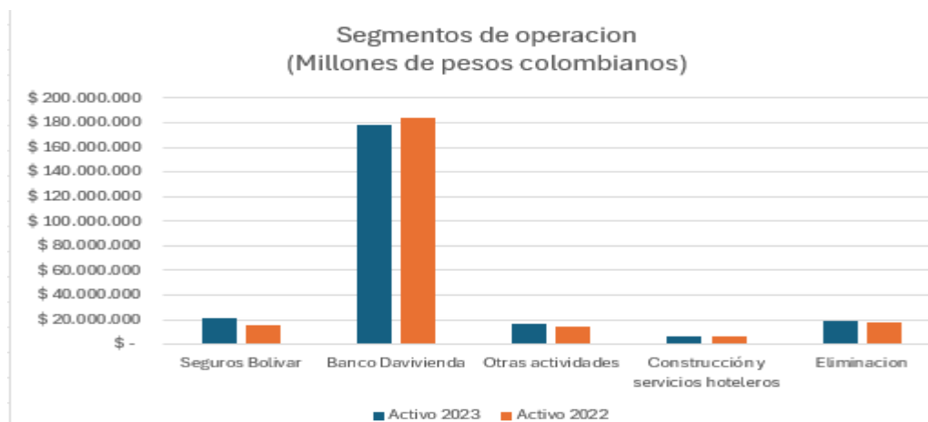
Figura 2. Segmentación de Operaciones.