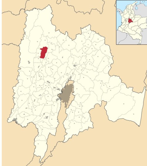
Figura 1. Localización municipio de La Peña Cundinamarca.