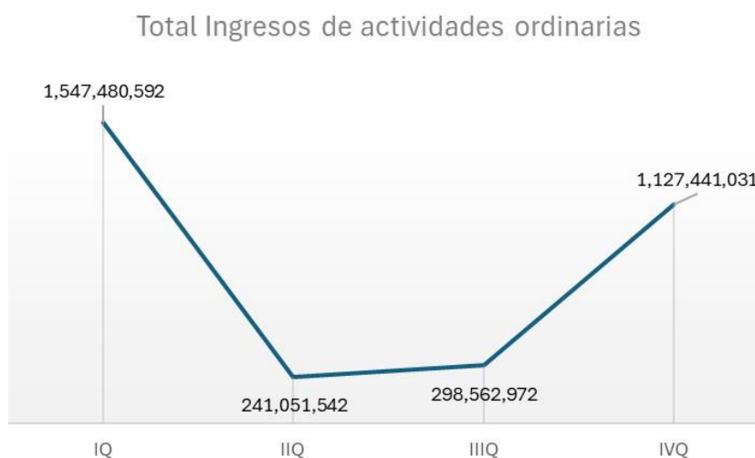
Figura 1 Total de ingresos de actividades ordinarias

(Resultados trimestrales Promigas, 2024)