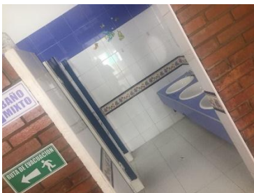
Figura 5 Baños Jardines 1-2

Luego pasamos a los baños de los jardines, jardín 1 y 2 tiene 2 baños 1 para niñas y 1 para niños, con su respectivo lavamanos y espejo este es de color amarillo. Seguidos de ellos están los baños de jardines 3 y 4 tienen la misma estructura de los anteriores lo único que cambia es su color es azul.