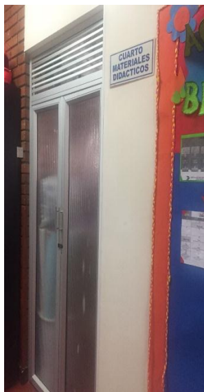
Figura 13 Recursos Didácticos

La institución tiene un cuarto con recursos didácticos que consta de rompecabezas, fichas de lego, fichas de encastre, tablas de ensartado entre otros para poder utilizar los materiales se debe diligenciar una ficha describiendo que sale y su estado y lo mismo cuando ingresa.