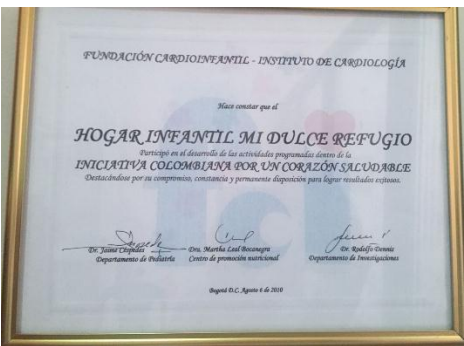
Figura 9 reconocimiento 1