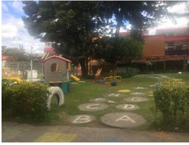
Figura 3 Parque