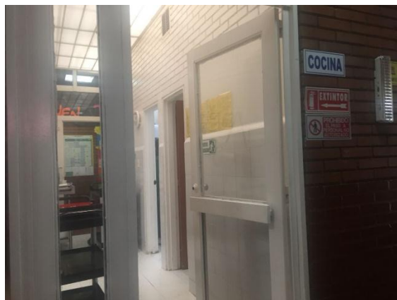
Figura 14 Cocina

La cocina es amplia pero por motivos de higiene y salubridad no fue posible entrar a realizar fotografías, solo la parte de en frente.