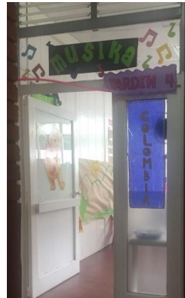
Figura 8 Salón Música

En la institución algunos docentes y directivas han recibido algunos reconocimientos por las diferentes actividades que se han realizado y están exhibidas en la oficina pri