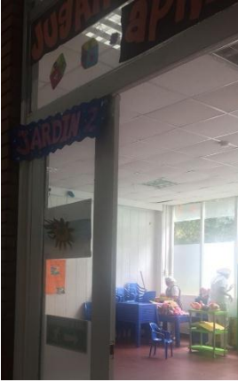
Figura 7 Salón Juego