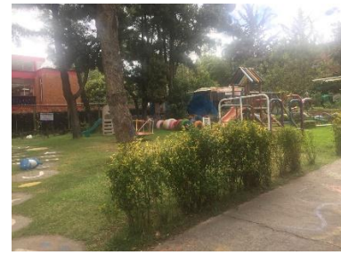
Figura 4 Parque

Luego pasamos a los cambiadores de las sala cunas pero no fue posible acceder a ellos, estaban en cambio de pañal después de la hora de sueño y son 50 niños para cambios de pañal.