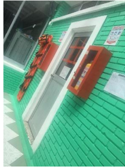
Figura 11 Primeros auxilios

También hay una sala de lactancia materna queda junto a Sala cuna 2, consta de 3 sillas reclinables plásticas de color blancas con una espuma y su respectivo forro y con su respectivo descansadero. También hay dos muebles medianos uno en donde se almacenan implementos de aseo para las madres lactantes y el otro una especie de nevera o banco de leche.