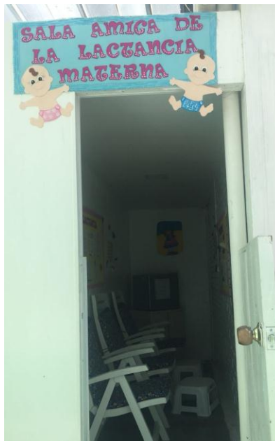
Figura 12 Sala lactancia Materna

También hay una sala de lactancia materna queda junto a Sala cuna 2, consta de 3 sillas reclinables plásticas de color blancas con una espuma y su respectivo forro y con su respectivo descansadero. También hay dos muebles medianos uno en donde se almacenan implementos de aseo para las madres lactantes y el otro una especie de nevera o banco de leche.