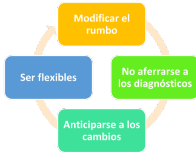
Figura 1. Habilidades de emprendimientos Creación propia, 2020

El fin del emprendimiento sostenible es lograr el desarrollo sostenible, mediante el descubrimiento, evaluación y explotación de oportunidades y la creación de valor que provoca la prosperidad económica, la cohesión social y la protección del medio ambiente (Moreno D.C 2016). Para lograr este emprendimiento sostenible se debe adoptar una mentalidad emprendedora, flexibilidad a la hora de tomar decisiones, un propósito definido, confianza, autodisciplina, liderazgo, trabajo en equipo, relacionamiento, difusión (dar a conocer la idea) y exposición de esta.