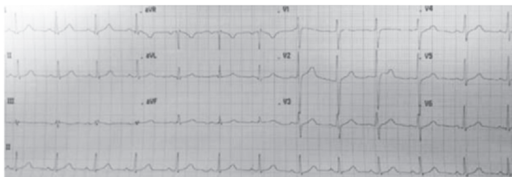
Figura 2 Electrocardiograma normal sin cambios en la repolarización.