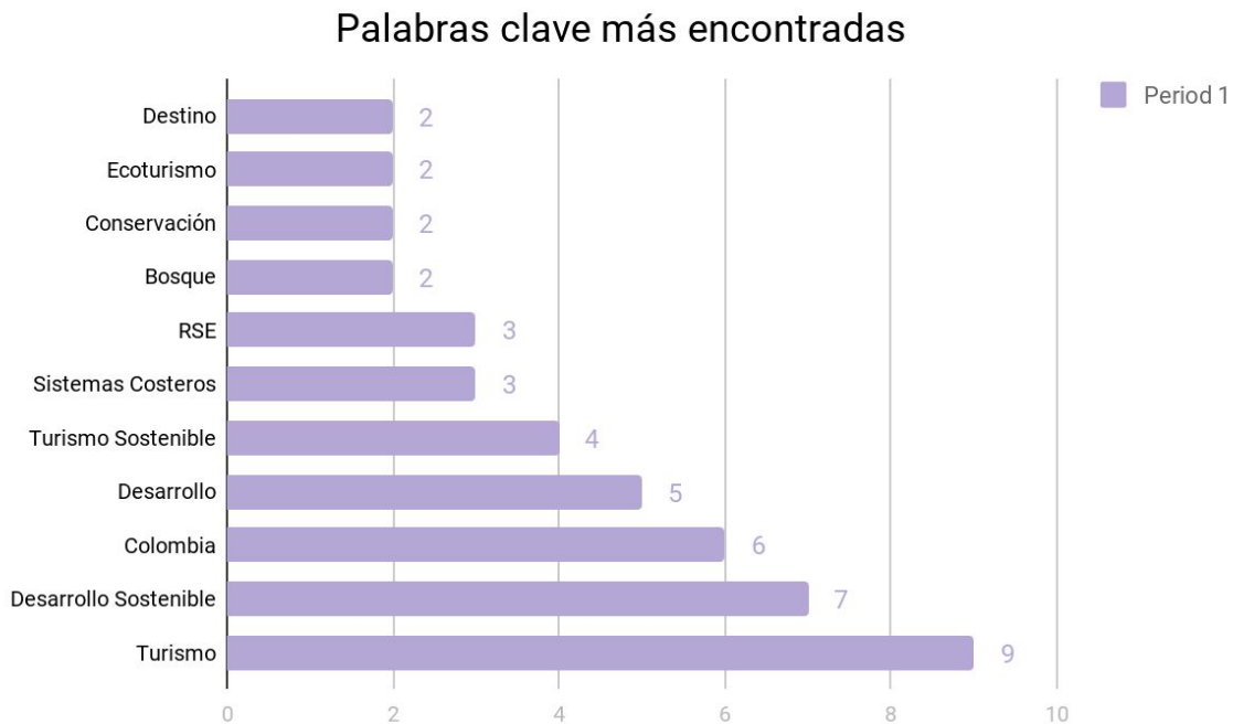
Figura 3. Palabras clave según frecuencia.

Con base en el anterior cuadro, fue posible identificar las palabras clave más encontradas en los 23 artículos seleccionados como muestra, en donde se evidencia as palabras más comunes son “turismo”, “Desarrollo Sostenible”, “Colombia”, “Desarrollo” y “Turismo Sostenible”; según se indica en la figura 3.